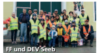
FF und DEV Seeb