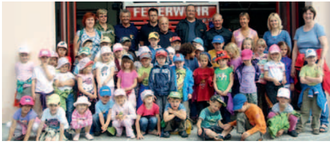
Die Kindergartenkinder beim Besuch der Feuerwehr Gföhl.