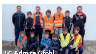
SC Admira Gföhl