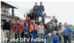
FF und DEV Felling