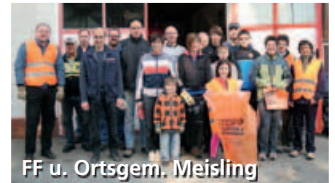
FF u. Ortsgem. Meisling