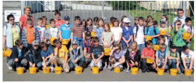
Über 80 Volksschüler wurden im ASZ Gföhl „unterrichtet“.