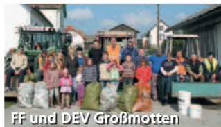
FF und DEV Großmotten