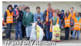
FF und DEV Reitern