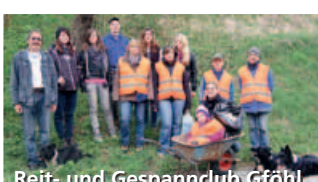
Reit- und Gespannclub Gföhl