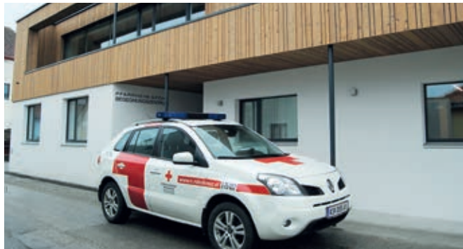
Das Pfarrheim Gföhl ist neuer Blutspende-Standort.

Der Ablauf des Blutspendens hat sich in den letzten Jahren immer wieder verändert, weil neue gesetzliche Vorgaben für mehr Sicherheit und Wahrung der Privatsphäre der SpenderInnen eingehalten werden müssen. Deshalb sind Diskretionen notwendig, um die Gespräche zwischen Arzt und BlutspenderInnen in vertraulicher Atmosphäre durchführen zu können. Aufgrund dessen ist die Rot-Kreuz-Ortsstelle Gföhl von der Blutspendezentrale angewiesen worden, diese Vorgaben umzusetzen. So war es erforderlich, den bisherigen Abnahmeort vom Gasthaus Haslinger ins neue Pfarrheim im Oberen Bayerland 4 zu verlegen. Die baulichen Gegebenheiten sind dort für die Einhaltung der Privatsphäre und Dis-