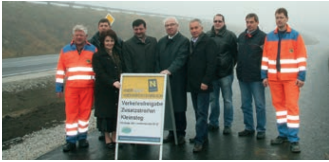
Eröffnung des Zusatzstreifens Kleinsteggraben

Im Straßeninfrastrukturkonzept für das Waldviertel sind Maßnahmen festgelegt, die einerseits die Verkehrssicherheit erhöhen und andererseits die Wirtschaftsstandorte des Waldviertels sichern. Um die Verkehrssicherheit auf der B37 zu erhöhen, hat sich das Land NÖ dazu entschlossen, an neuralgischen Stellen Zusatzstreifen zu errichten. Die Bauarbeiten für einen weiteren Zusatzstreifen im Bereich Eisengraben – Rastbach sind